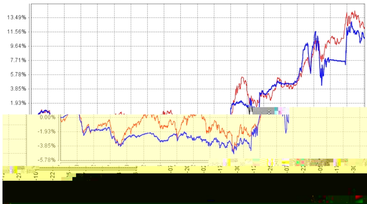
长信先利半年定开混合C基金份额累计净值增长率与同期业绩比较基准收益率的历史走势对比图