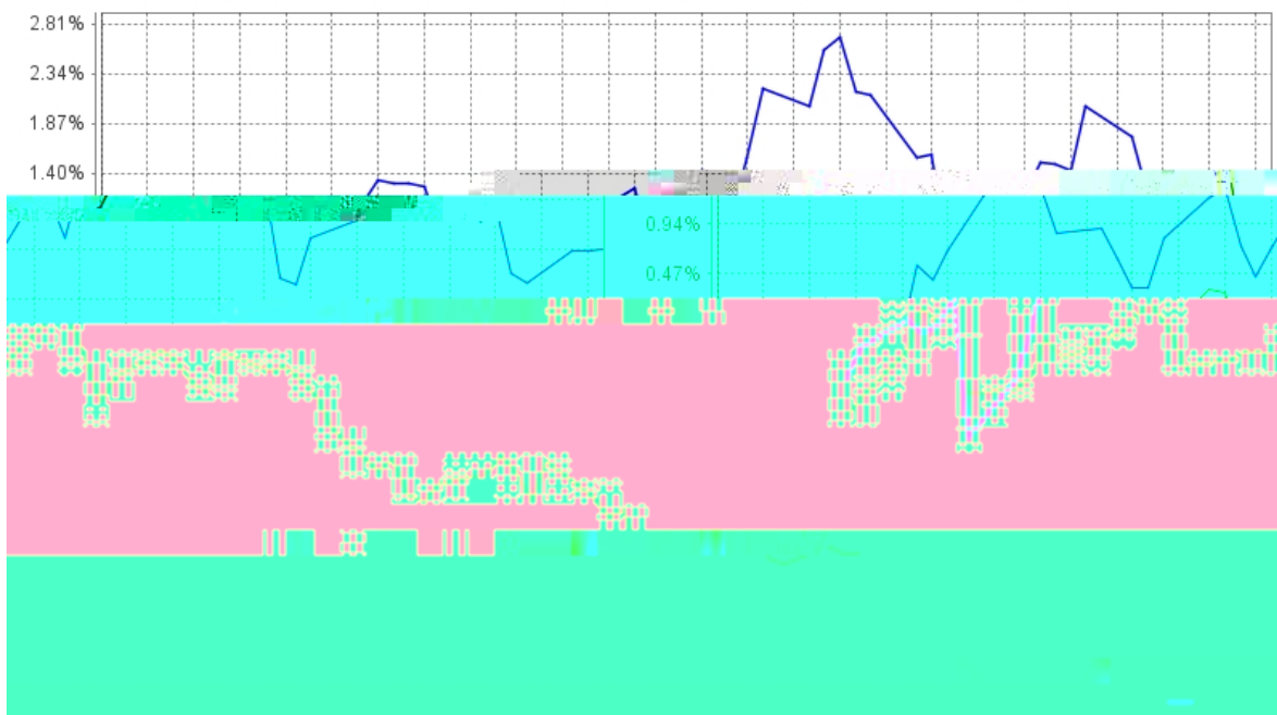
长信稳健精选混合C基金份额累计净值增长率与同期业绩比较基准收益率的历史走势对比图