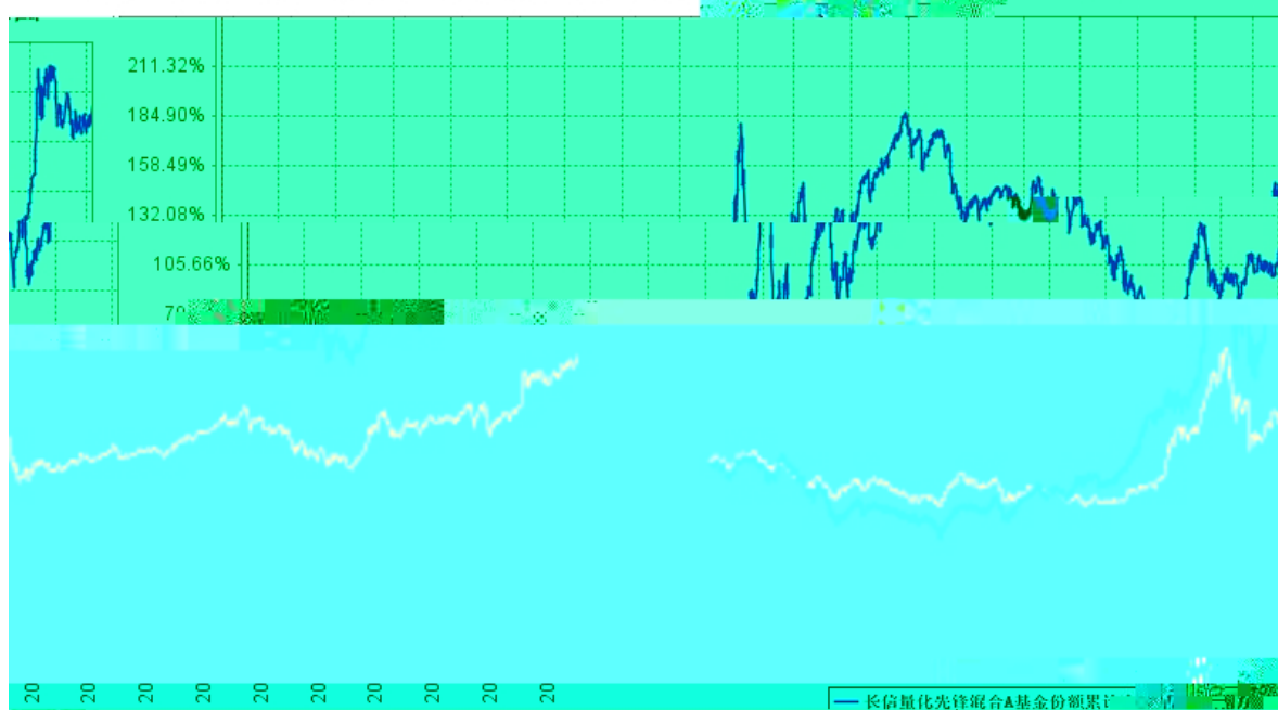
长信量化先锋混合A基金份额累计净值增长率与同期业绩比较基准收益率的历史走势对比图