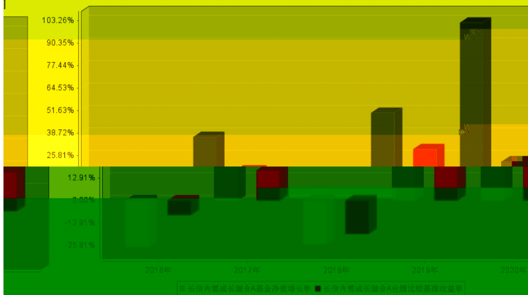
长信内需成长混合A过去五年基金每年净值增长率及其与同期业绩比较基准收益率的对比图