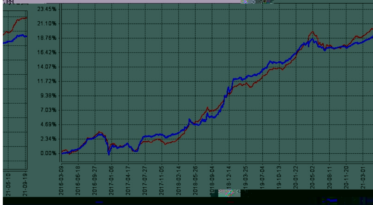
长信富全纯债一年定开债券A基金份额累计净值增长率与同期业绩比较基准收益率的历史走势对比图