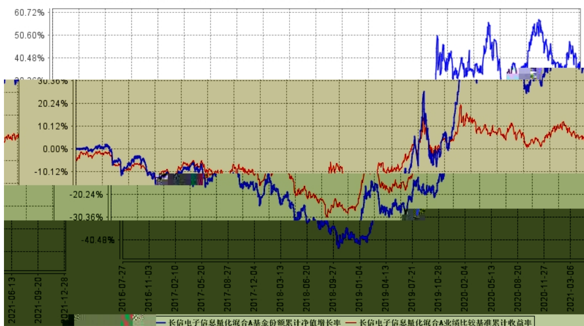
长信电子信息量化混合A基金份额累计净值增长率与同期业绩比较基准收益率的历史走势对比图