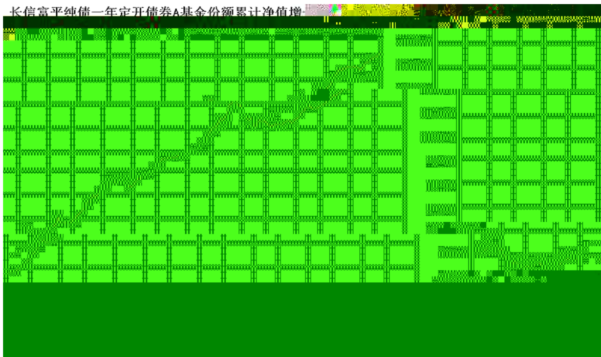
长信富平纯债一年定开债券A基金份额累计净值增