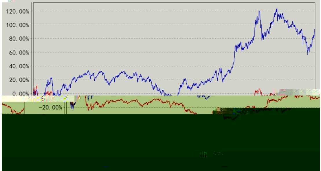
长信量化多策略股票A累计净值增长率与同期业绩比较基准收益率的历史走势对比图