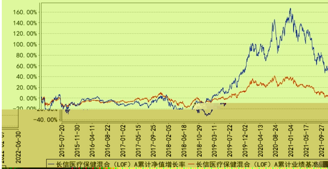
长信医疗保健混合(LOF) A累计净值增长率与同期业绩比较基准收益的历史走势对比图