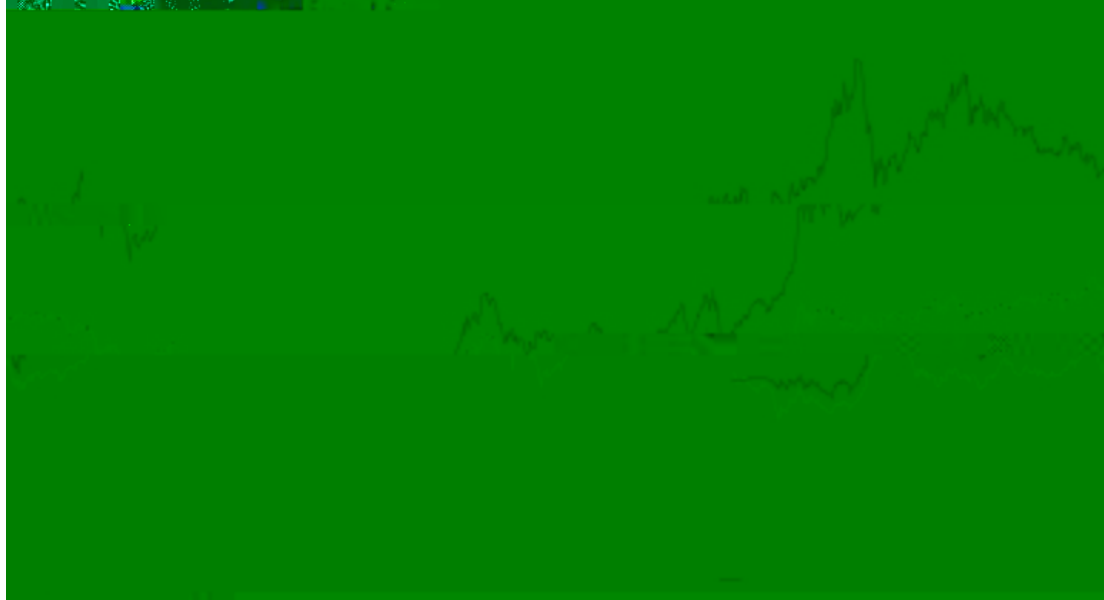
长信量化价值驱动混合A累计净值增长率与同期业绩比较基准收益率的历史走势图