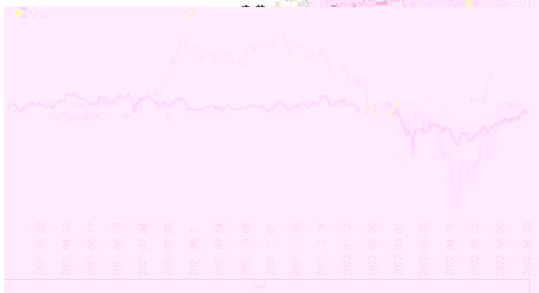
长信稳健均衡6个月持有期混合A累计净值增长率与同期业绩比较基准收益率的历史