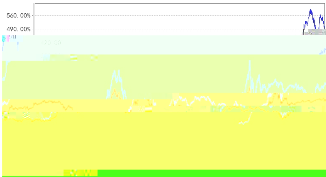
长信金利趋势混合A累计净值增长率与同期业绩比较基准收益率的历史走势对比图