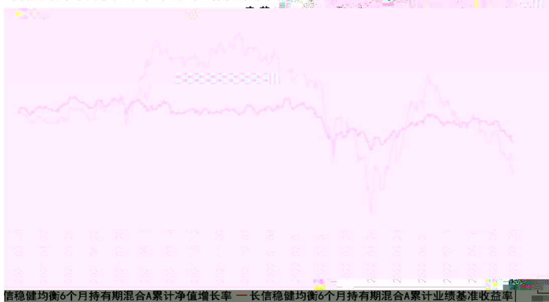
长信稳健均衡6个月持有期混合A累计净值增长率与同期业绩比较基准收益率的历史