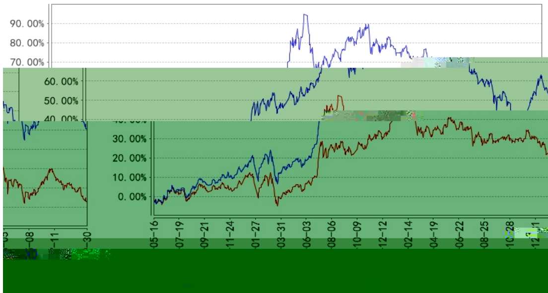
长信沪深300指数A累计净值增长率与同期业绩比较基准收益率的历史走势对比图