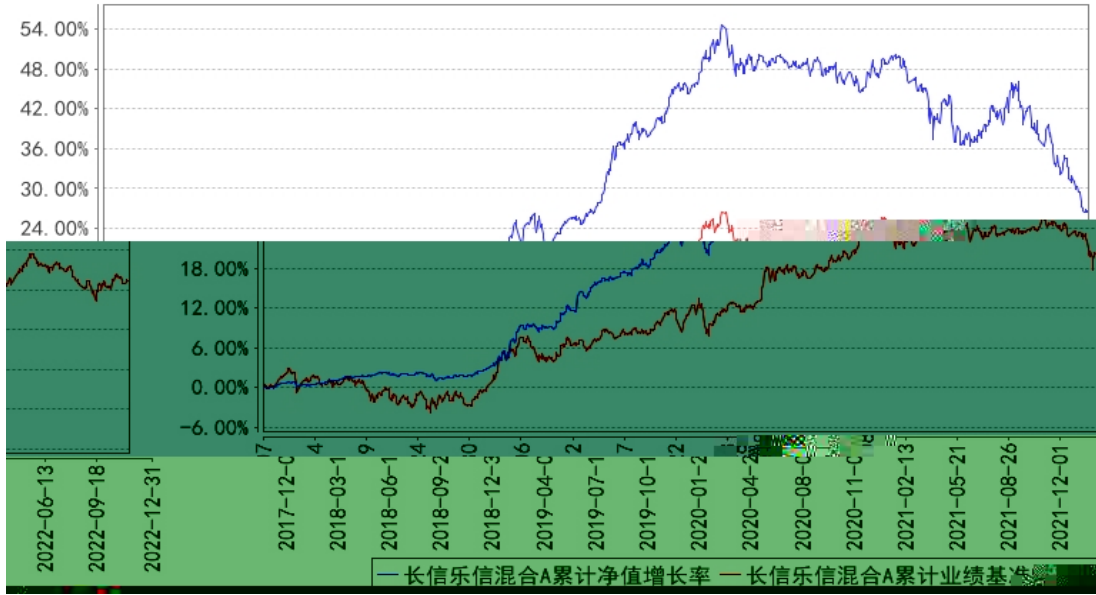
长信乐信混合A累计净值增长率与同期业绩比较基准收益率的历史走势对比图