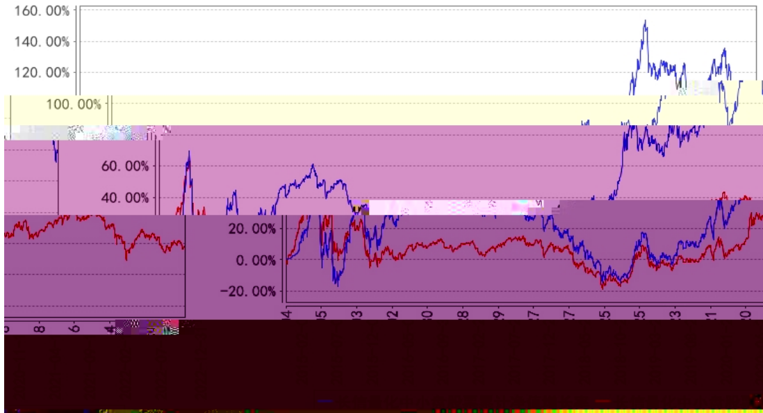
长信量化中小盘股票累计净值增长率与同期业绩比较基准收益率的历史走势对比图