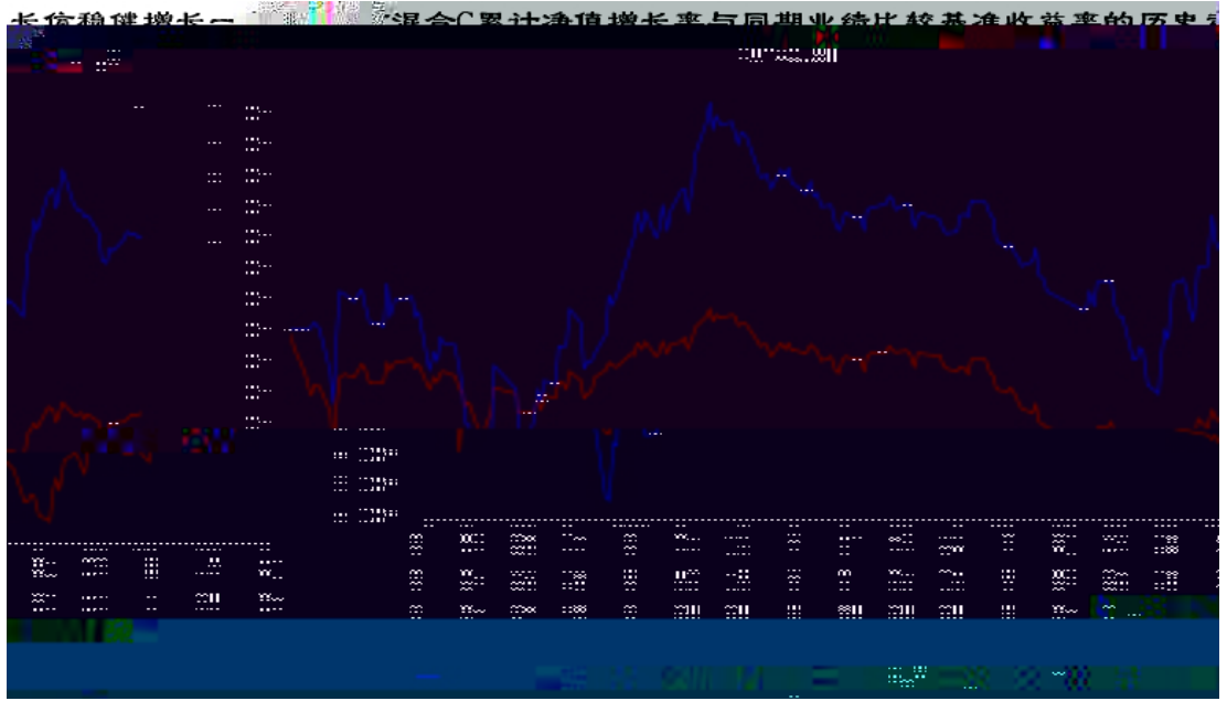
长信稳健增长一年持有混合A基金每年净值增长率与同期业绩比较基准收益率的对比图