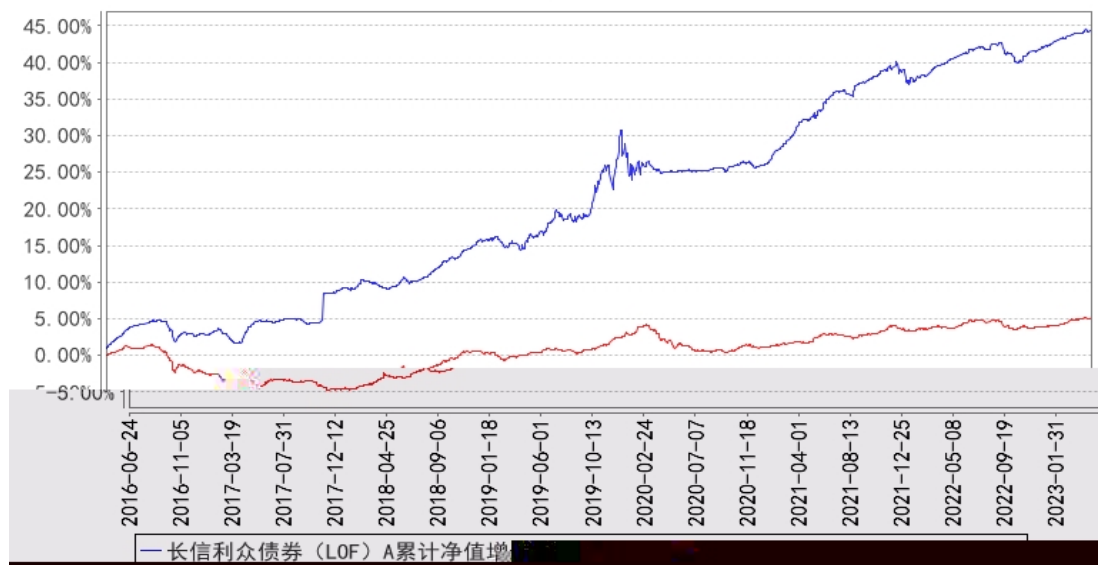
长信利众债券 (LOF) A 累计净值增长率与同期业绩比较基准收益率的历史走势对比图