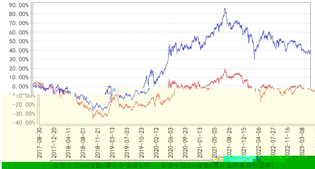
长信中证500指数A累计净值增长率与同期业绩比较基准收益率的历史走势对比图