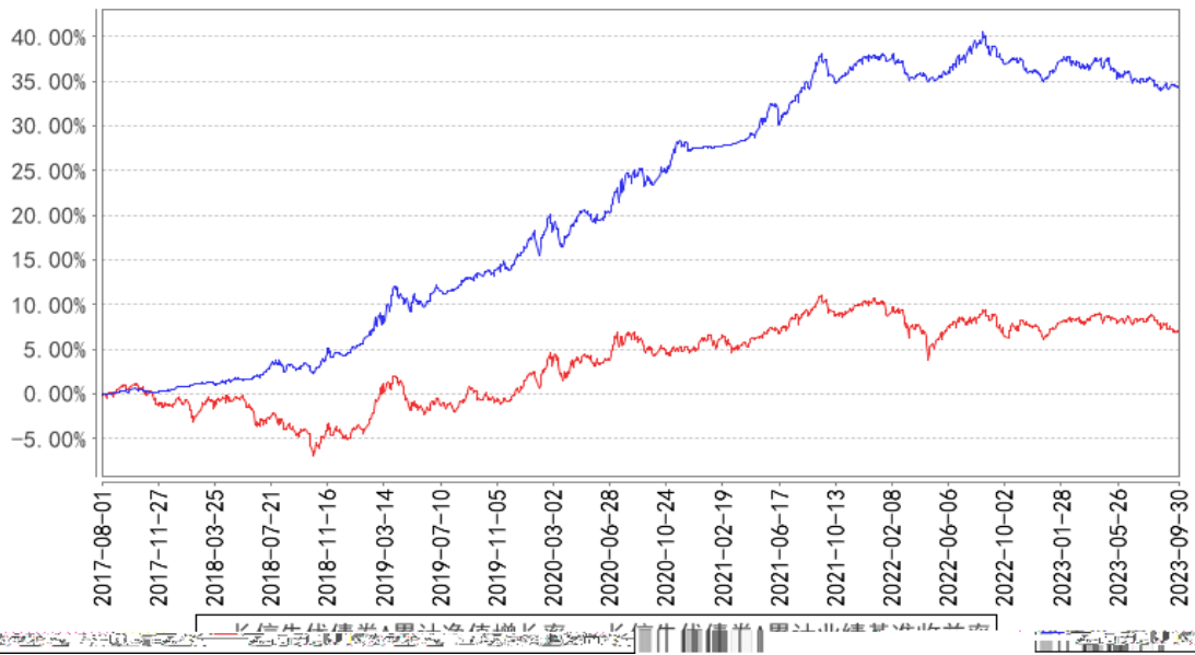
长信先优债券A累计净值增长率与同期业绩比较基准收益率的历史走势对比图