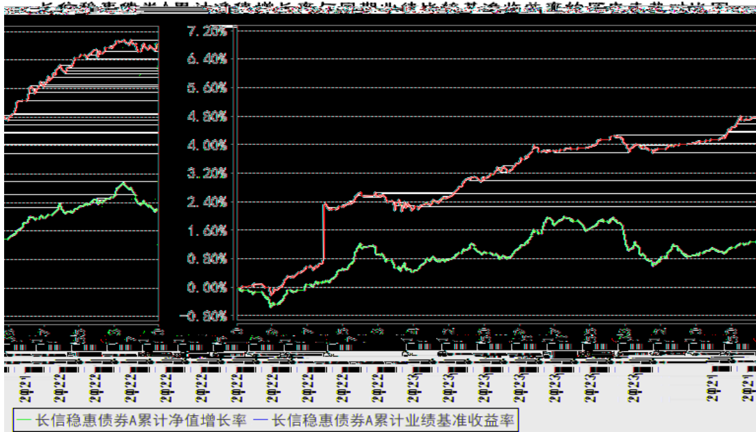
长信稳惠债券C累计净值增长率与同期业绩比较基准收益率的历史走势对比图