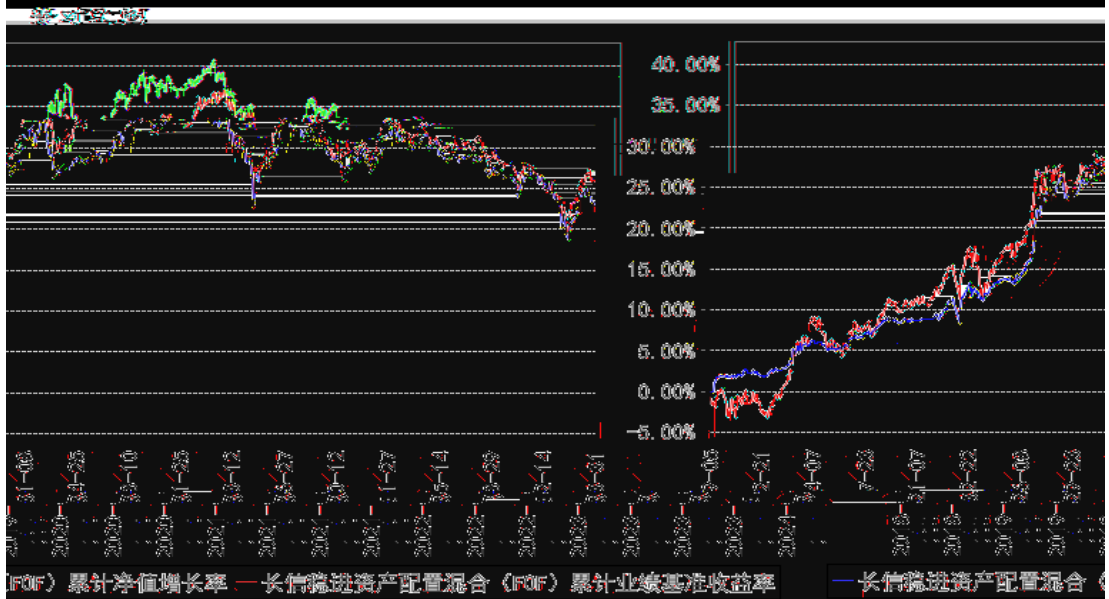
长信稳进资产配置混合 (FOF) 累计净值增长率与同期业绩比较基准收益率的历史走