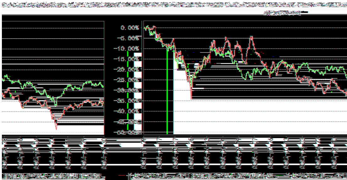
长信先进装备三个月持有混合C累计净值增长率与同期业绩比较基准收益率的历史走势对比图