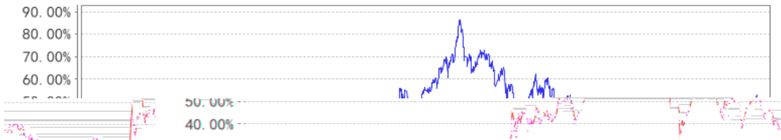
长信中证500指数A累计净值增长率与同期业绩比较基准收益率的历史走势对比图