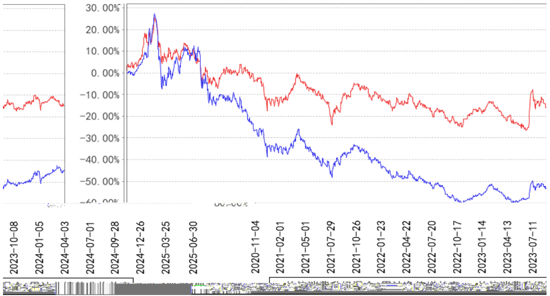
长信消费升级混合A累计净值增长率与同期业绩比较基准收益率的历史走势对比图