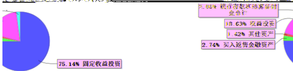
投资组合资产配置图表 (2024年2月21日)