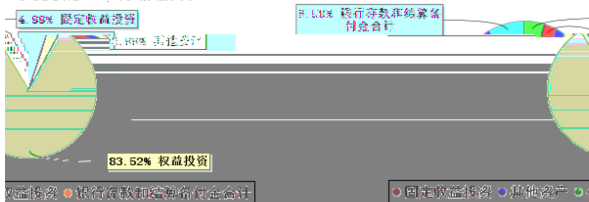
投资组合资产配置图表(2025年3月31日)