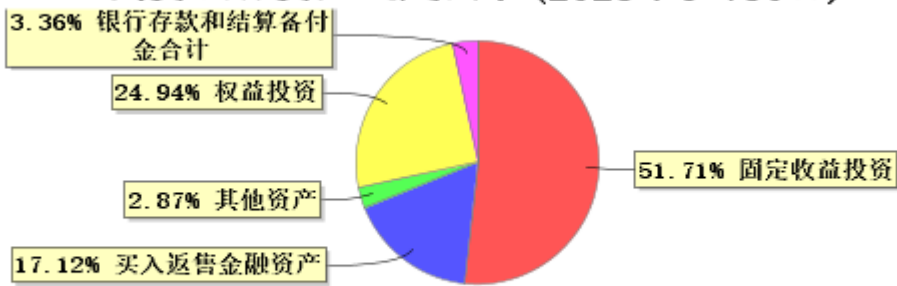
投资组合资产配置图表(2025年6月30日)