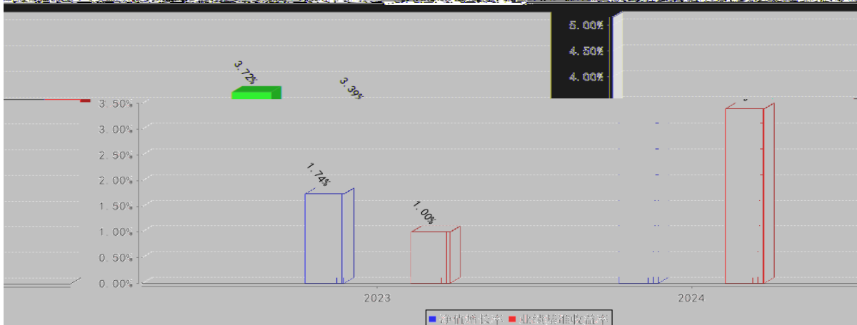
长信90天滚动持有债券A基金每年净值增长率与同期业绩比较基准收益率的对比图 (2024年12月31日)

# Ö Æ J5 >)à Z! O ð 8 Ä *H E ÷ ° J5 = > Z • >)à Ä Æ Y% Ø 19 jh -NíÁÑ1Ç OL$ j *H 8 <+O x ð 8 8# ð 8 È ð Ì ÎK)· 9K Y% Ø 19 jh -Ní ÎLu ^5 O AÑ1Ç Ä